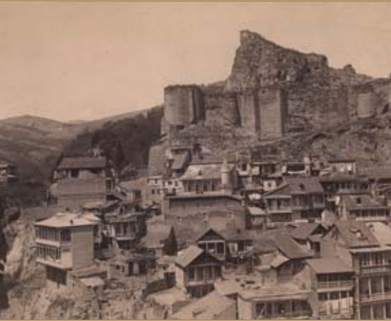
Tiflis, zeitgenössische Photographie aus dem Besitz Bertha von Suttners Tbilisi in a contemporary photograph in Suttner's possession.