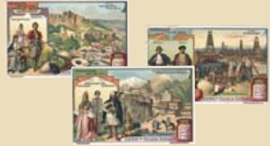
Auf farbenfrohen Sammelbildchen wird das „exotische“ Leben auf dem Kaukasus dargestellt. Colourful collectable cards depicting the „exotic“ life in the Caucasus.