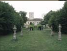
Schloss Harmannsdorf heute Schloss Harmannsdorf today

Im Landschloss Harmannsdorf in Niederösterreich verlebt Bertha im Kreise der Familie Suttner eine glückliche Zeit. Bertha spent a happy time with the Suttners at the country estate in Harmannsdorf in Lower Austria.