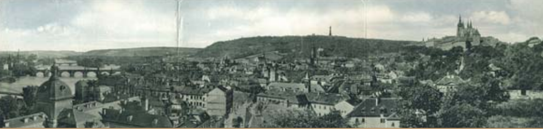
Prag, Photographie um 1900 aus Suttners Besitz – Prague, photograph ca. 1900, from Suttner's property