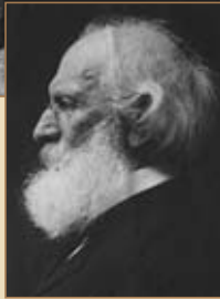
Drei wichtige Mitkämpfer der Suttner: der Deutsche Rudolf Virchow, der Schweizer Elie Ducommun und der Franzose Frédéric Passy Three important fellow campaigners of Suttner: the German Rudolf Virchow, the Swiss Elie Ducommun and the Frenchman Frédéric Passy

Alfred Nobel bleibt Suttner gegenüber skeptisch: „Meine Fabriken werden vielleicht dem Krieg noch früher ein Ende machen als Ihre Kongresse: an dem Tag, da zwei Armeekorps sich gegenseitig in einer Sekunde werden vernichten können, werden wohl alle zivilisierten Nationen zurückschauern und ihre Truppen verabschieden.“ Alfred Nobel remains sceptical of Suttner's endeavours: “My factories may eventually end war sooner than your congresses. On the day when two armies may obliterate each other in a second, all civilized nations will recoil and dismiss their troops.”