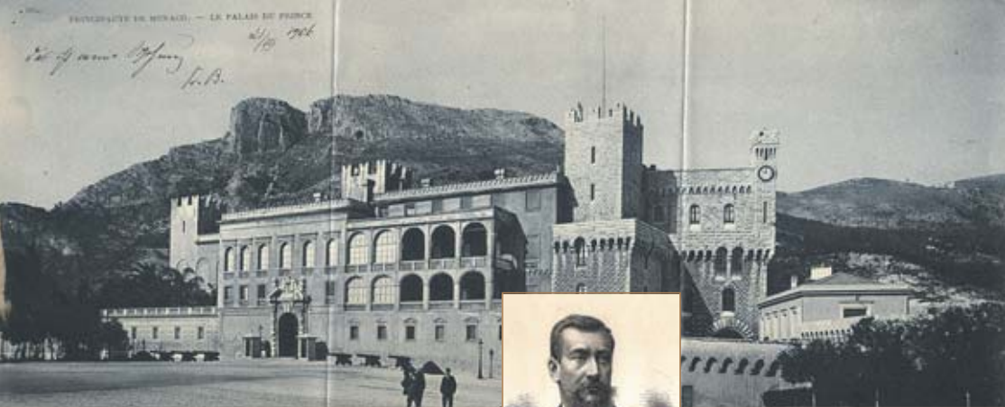
Der Palast von Monaco. Suttners Postkarte an ihre Haushälterin in Wien mit der eigenhändigen Anmerkung: „Das ist meine Wohnung.“ The palace of Monaco. Suttner's postcard to her housekeeper in Vienna with a handwritten comment: "This is my apartment."