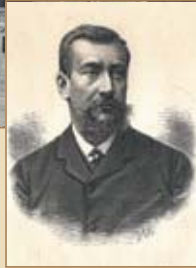
Fürst Albert von Monaco Prince Albert of Monaco