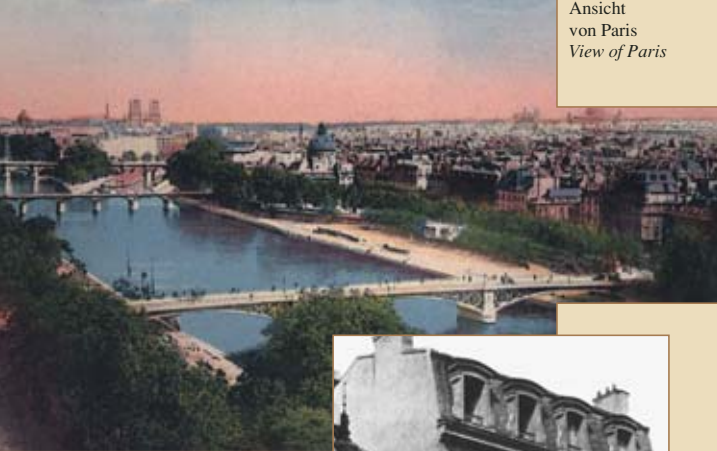
Ansicht von Paris View of Paris