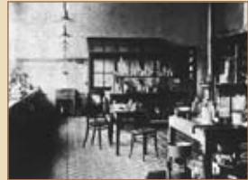
Nobels chemisches Labor Nobel's chemical laboratory

„Ich möchte einen Stoff oder eine Maschine schaffen können von so fürchterlicher, massenhaft verheerender Wirkung, daß dadurch Kriege überhaupt unmöglich würden.“ “I want to create a substance or machine of such tremendous destructive power that all wars would become impossible.” (A. Nobel)