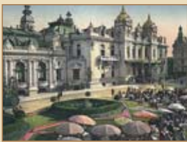
Das berühmte Casino von Monte Carlo The famous casino of Monte Carlo