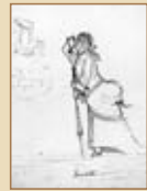
Bertha von Suttner, von ihrem Mann in Georgien als dicklich und kurzsichtig karikiert Bertha von Suttner as an overweight and short-sighted woman (caricature drawn by her husband).

Aus Liebe zu Arthur von Suttner verlässt Bertha 1876 Paris. Nach der heimlichen Hochzeit zieht das Paar nach Georgien. Die Geldsorgen sind quälend: durch Sprach- und Musikunterricht trägt Bertha zum Lebensunterhalt bei.