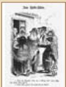
Zeitgenössische antisemitische Karikatur Contemporary anti-Semitic caricature

Prominente Mitglieder des „Anti-Vereins“: Prominent members of the “Anti-Verein”: Ludwig Ganghofer, Schriftsteller author; Hermann Nothnagel, Mediziner doctor of medicine; Johann Strauß Sohn, Komponist composer; Carl von Hasenauer, Architekt architect; Peter Rosegger, Schriftsteller author; Richard von Krafft-Ebing, Psychiater psychiatrist