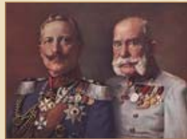
In verhängnisvoller „Nibelungentreue“ verbündet: der österreichische Kaiser Franz Josef (rechts) und der deutsche Kaiser Wilhelm II. United in fatal “Nibelung” loyalty: the Austrian Emperor Franz Josef (right) and the German Emperor Wilhelm II.