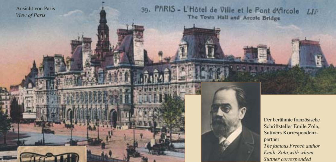
Ansicht von Paris View of Paris

39. PARIS - L'Hôtel de Ville et le Pont d'Arcole LIP The Town Hall and Arcole Bridge