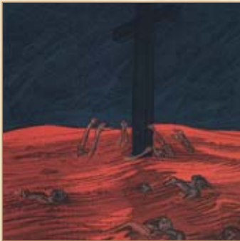
„Der Balkan versinkt im Blut“: 1. Balkankrieg 1911, 2. Balkankrieg 1913, 3. Balkankrieg 1914 als Auslöser des Weltkrieges. “The Balkan drowns in blood”: 1st Balkan War 1911, 2nd Balkan War 1913, 3rd Balkan War 1914 as a cause for the World War.