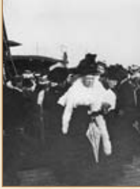
Bis zuletzt kämpft Suttner darum, den drohenden Krieg zu verhindern. Suttner struggled to the end to prevent the looming war.

„Die Menschen begreifen nicht, was vorgeht ... Warum tut ihr nichts, ihr jungen Leute? Euch geht es vor allem an! Wehrt euch doch, schließt euch zusammen! Laßt nicht immer alles uns paar alte Frauen tun, auf die niemand hört.“ (Suttner zu Stefan Zweig) “People don’t understand what is happening ... Why don’t you do something, you, young people? This concerns especially you! Defend yourselves, unite! Don’t leave the work to be done to old women to whom no one listens.” (Suttner to Stefan Zweig)