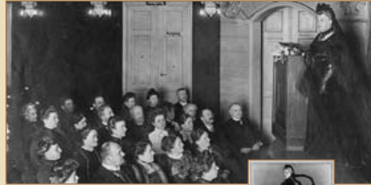
Die elegante Witwe als Vortragende The elegant widow as a lecturer