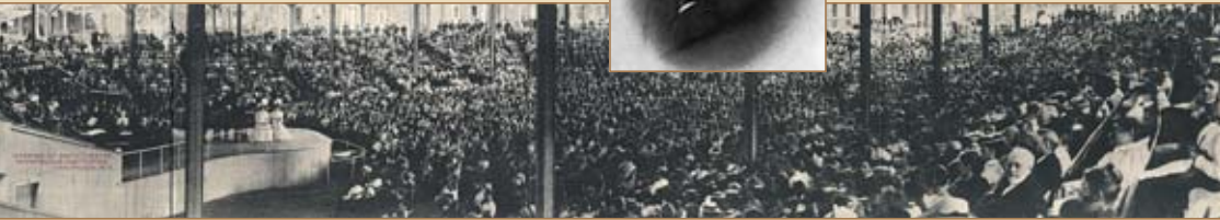
Das Amphitheater von Chautauqua, N. Y. Vor Tausenden hält Suttner ihre englischen Friedensvorträge. The Chautauqua amphitheatre, N. Y. Suttner giving a peace lecture in English in front of thousands.

Der amerikanische Großindustrielle Andrew Carnegie fördert die Friedensbewegung mit Millionenbeträgen. The American industrialist Andrew Carnegie supported the peace movement with millions of dollars.