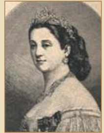
Fürstin Ekaterina von Mingrelien, Gönnerin der Suttners Princess Ekaterina of Mingrelia, benefactor of the Suttners